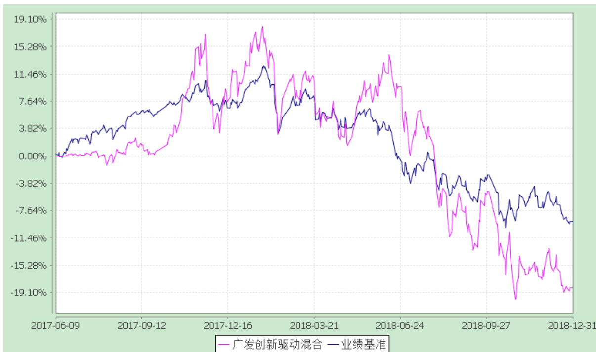
广发创新驱动灵活配置混合型证券投资基金 份额累计净值增长率与业绩比较基准收益率的历史走势对比图 (2017 年 6 月 9 日至 2018 年 12 月 31 日)