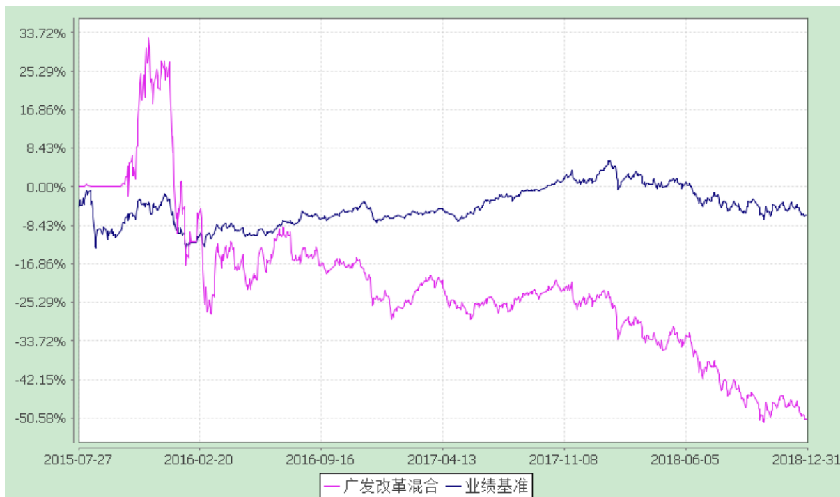
广发改革先锋灵活配置混合型证券投资基金 份额累计净值增长率与业绩比较基准收益率的历史走势对比图 (2015 年 7 月 27 日至 2018 年 12 月 31 日)