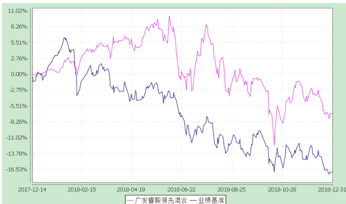
份额累计净值增长率与业绩比较基准收益率的历史走势对比图 (2017 年 12 月 14 日至 2018 年 12 月 31 日)

注：本基金建仓期为基金合同生效后 6 个月，建仓期结束时各项资产配置比例符合本基金合同有关规定。