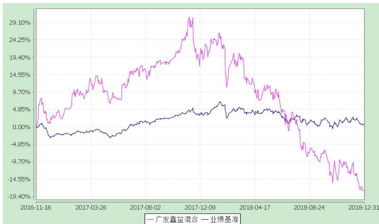
广发鑫益灵活配置混合型证券投资基金 份额累计净值增长率与业绩比较基准收益率的历史走势对比图 (2016 年 11 月 16 日至 2018 年 12 月 31 日)