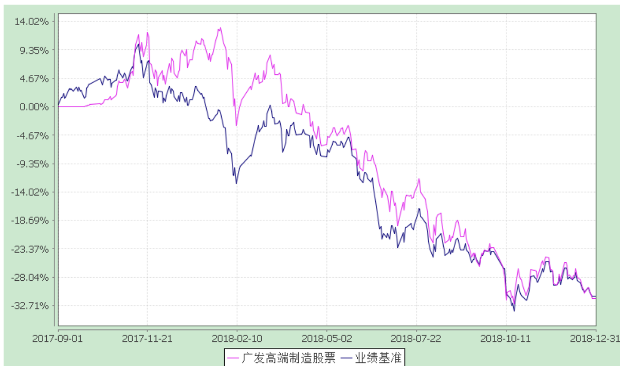
广发高端制造股票型发起式证券投资基金 份额累计净值增长率与业绩比较基准收益率的历史走势对比图 (2017 年 9 月 1 日至 2018 年 12 月 31 日)

注：本基金建仓期为基金合同生效后 6 个月，建仓期结束时各项资产配置比例符合本基金合同有关规定。