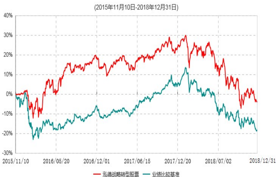
泓德战略转型股票型证券投资基金累计净值增长率与业绩比较基准收益率历史走势对比图

注：根据基金合同的约定，本基金建仓期为6个月，截至报告期末，本基金的各项投资比例符合基金合同关于投资范围及投资限制规定。