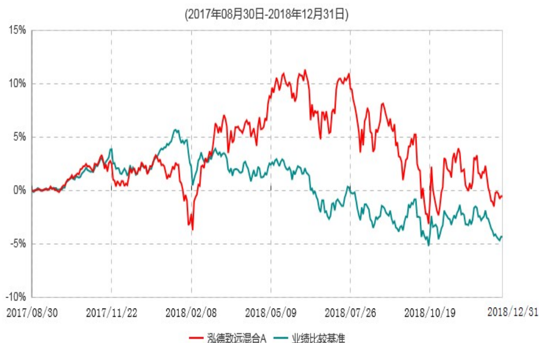
泓德致远混合A累计净值增长率与业绩比较基准收益率历史走势对比图