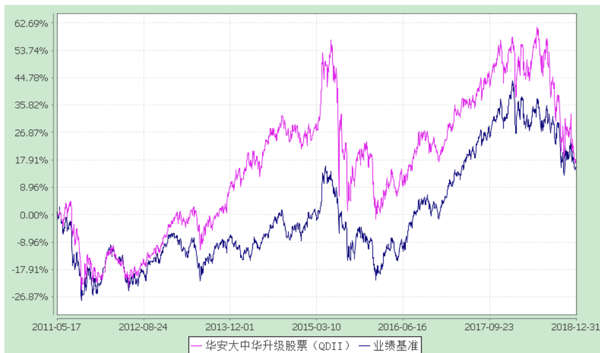
份额累计净值增长率与业绩比较基准收益率历史走势对比图 (2011 年 5 月 17 日至 2018 年 12 月 31 日)