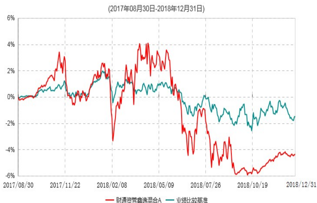
财通资管鑫逸混合A累计净值增长率与业绩比较基准收益率历史走势对比图