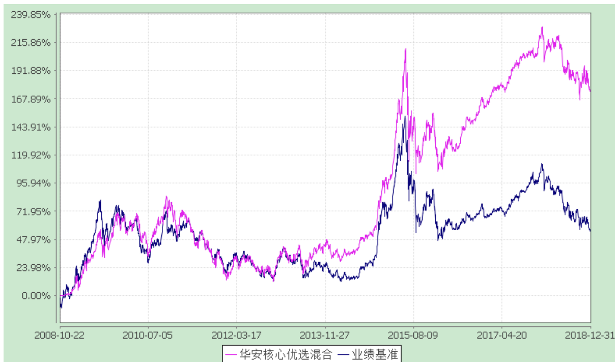
自基金合同生效以来份额累计净值增长率与业绩比较基准收益率的历史走势对比图 (2008 年 10 月 22 日至 2018 年 12 月 31 日)