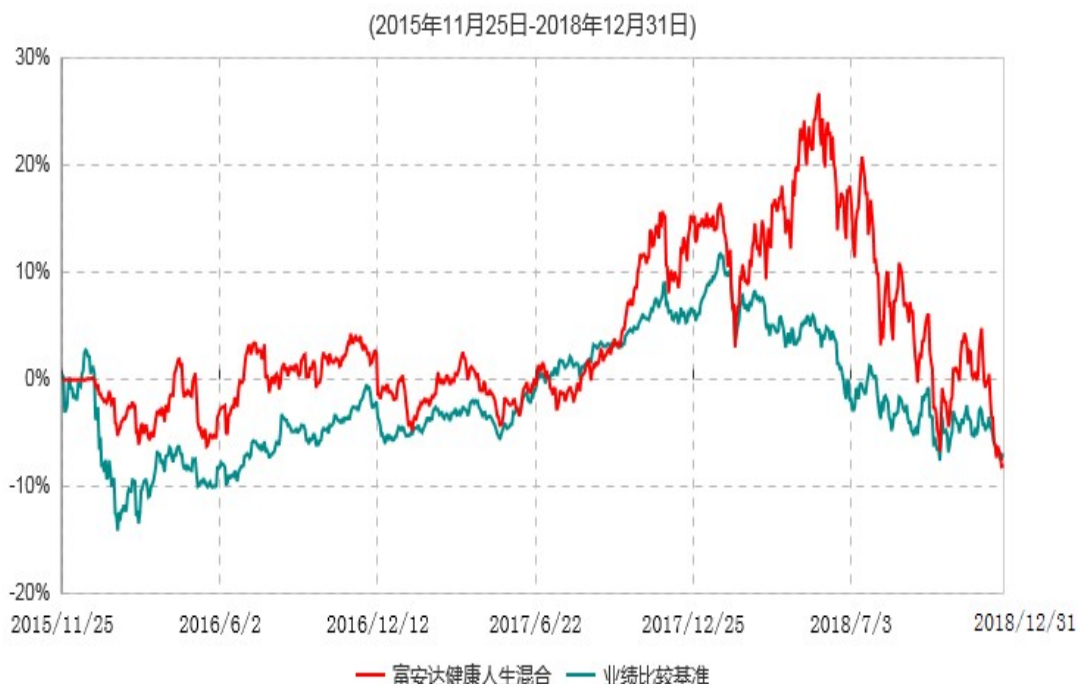
富安达健康人生灵活配置混合型证券投资基金累计净值增长率与业绩比较基准收益率历史走势对比图

根据《富安达健康人生灵活配置混合型证券投资基金基金合同》规定，本基金建仓期为6个月，建仓截止日为2016年5月24日。建仓期结束时本基金各项资产配置比例符合本基金合同规定的比例限制及投资组合的比例范围。