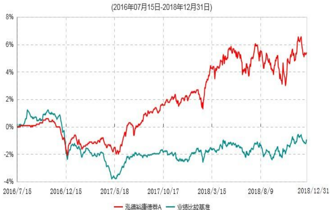
泓德裕康债券C累计净值增长率与业绩比较基准收益率历史走势对比图