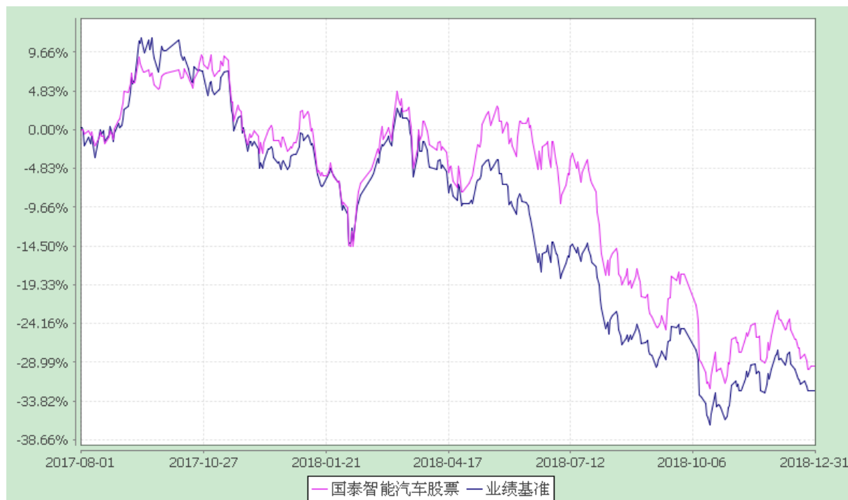
自基金合同生效以来份额累计净值增长率与业绩比较基准收益率的历史走势对比图 (2017 年 8 月 1 日至 2018 年 12 月 31 日)

注：本基金合同生效日为 2017 年 8 月 1 日，本基金在六个月建仓期结束时，各项资产配置比例符合合同约定。