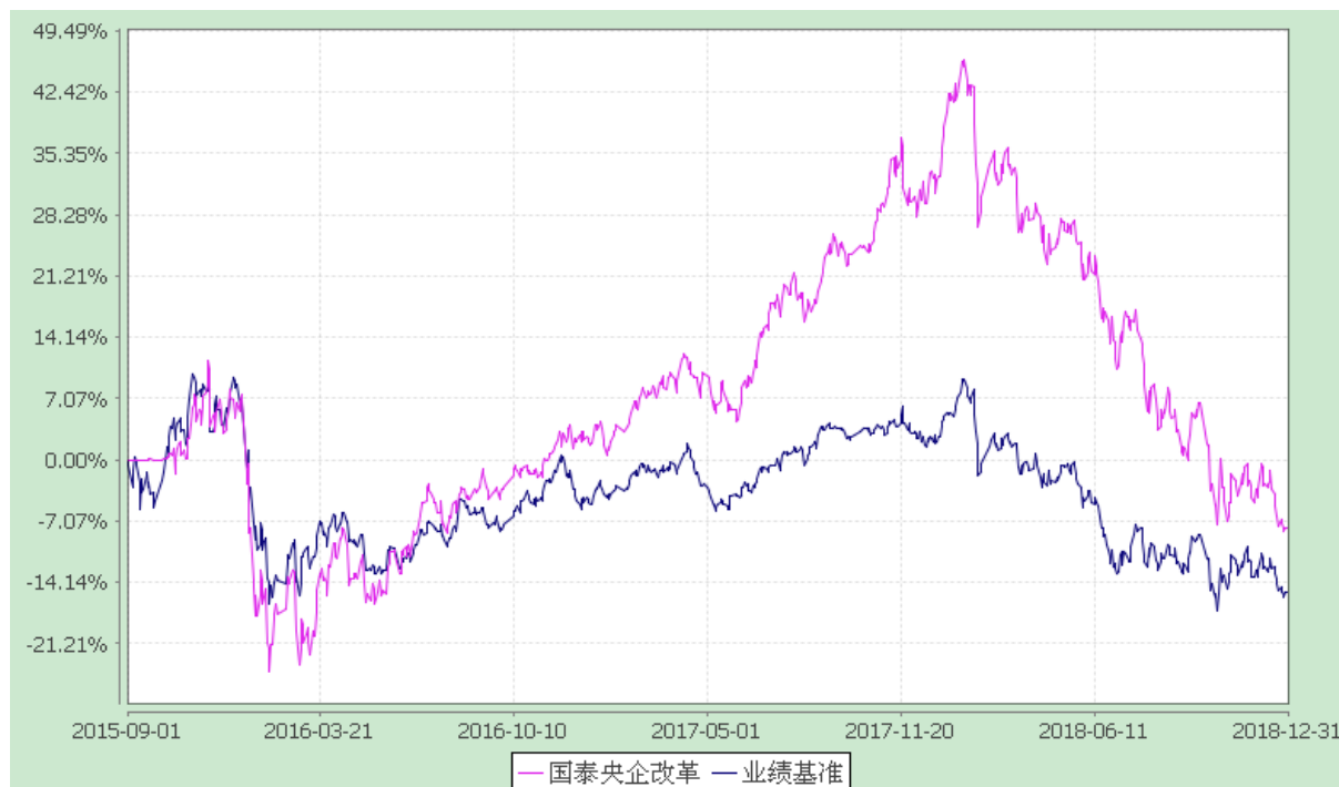
自基金合同生效以来份额累计净值增长率与业绩比较基准收益率的历史走势对比图 (2015 年 9 月 1 日至 2018 年 12 月 31 日)

注：本基金合同生效日为 2015 年 9 月 1 日。本基金在六个月建仓期结束时，各项资产配置比例符合合同约定。