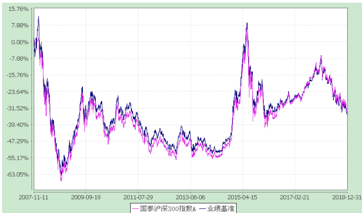
国泰沪深 300 指数 C