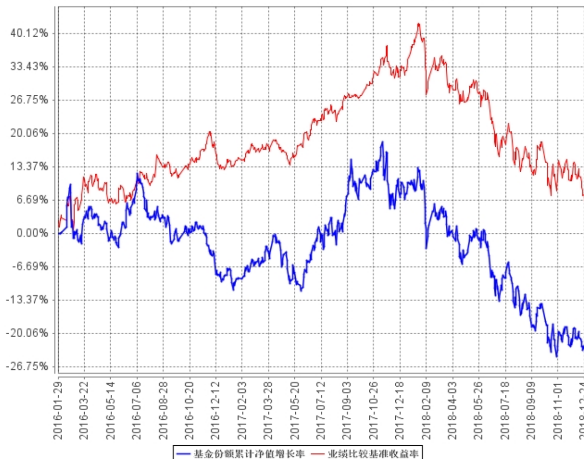
基金份额累计净值增长率与同期业绩比较基准收益率的历史走势对比图