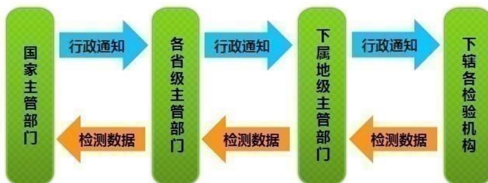
行业联网监督与管理的模式的示意图

(2) 联网监督与管理目前主要在地市级行政区开展，地市相关管理部门参与机动车检测日常的运行及监督审核服务，个别省级行政区目前已使用或正在建设全省安检联网监管系统，联网监督与管理目前已在所有行政区（省、市级）开展，现其处在根据实际监督与管理效果，迭代升级、联网监督与探索新的管理模式的阶段。