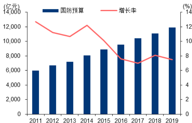
图表1：2011~2019年中国国防预算支出及增长率

近年来，我国国防投入持续加大，军工行业稳健发展。根据财政部每年的财政预算报告公布信息，2011年至2019年，我国国防经费预算增幅分别为12.7%、11.2%、10.7%、12.2%、10.1%、7.6%、7%、8.1%、7.5%，年平均增速为9.68%，近四年增长率稳定在7%~8%。考虑到我国幅员辽阔、人口总量庞大，预计随着国际形势动荡以及我国一带一路战略的推进，国防军工行业供给端增长明确，我国国防投入长期看仍有望稳健增长。