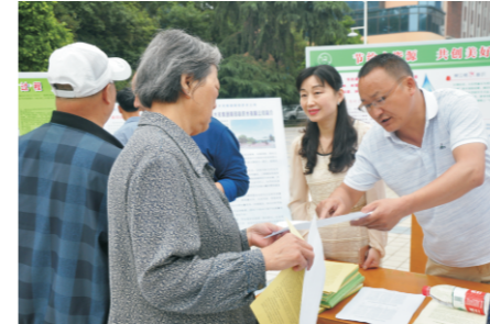
汉中水司向市民提供专题咨询服务

2018年8月12日，为了让市民近距离地接触自来水加工过程，了解了自来水的生产工艺和水质要求，提高节水、保水意识，湘潭国中水务有限公司邀请了湘潭环保协会的志愿者和湘潭一中学生参观自来水厂。活动结束后，志愿者和学生们纷纷表示感受到水的来之不易，在以后的生活中会从自身做起，更加珍惜水资源，做节水、护水的好公民！