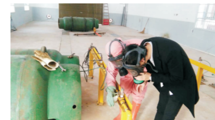
氯气泄漏应急预案演练