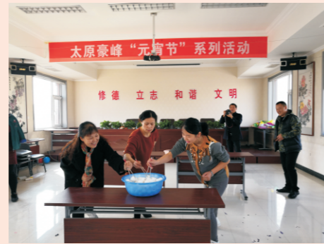
太原豪峰“元宵节”系列活动

2018年3月2日（农历正月十五），太原豪峰污水处理有限公司开展了以“继传统，促发展”为主题的元宵灯谜游艺系列活动。除了有传统的元宵节猜谜语外，还有“爆声隆隆闹元宵”、吃“汤圆”及“团结友爱”等游艺项目。让职工在紧张工作之余，增长了知识，开阔了思路，放松了身心，营造了欢乐、祥和的公司文化氛围。