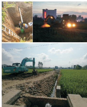
开拓新水源 保障夏季供水高峰

为了在夏季用水高峰前按时完工，汉中实业施工人员冒着40℃酷暑，在现场加速第二批水源井建设的作业，项目部经理几乎每个工作日都住在工地，汉中市政府也对此民生工程高度重视，市委副书记、市长方红卫亲自带领政府相关部门检查调研水源地建设情况。