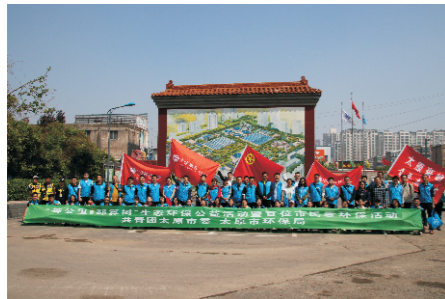
太原豪峰接待团市委和市民志愿者参观

为了纪念第三十一届中国水周，2018年3月28日，太原市晋源区五府营中心小学组织4~6年级40余名学生来到太原豪峰污水处理有限公司，参观污水处理工艺全过程。此次参观是太原豪峰近年来接待未成年人参观人数最多、规模最大的一次，不仅让师生们对节约水资源、保护生态水体的重要性有了进一步的认识和体会，而且大大增强了他们节约用水和保护水资源的意识，使他们明白了“节水、惜水、爱水”的重要性。