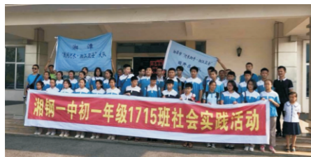
湘潭水务接待师生和环保协会环保志愿者参观

2018年7月25日，西宁市虎台中学初中一年级学生及家长在老师的带领下来到青海雄越环保科技有限责任公司参观、学习。活动旨在教育学生们保护环境从小做起、从自身做起，让保护水资源理念植根于广大青少年心中。