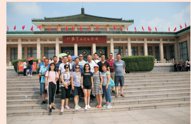
太原豪峰党员八路军太行纪念馆前合影

2018年7月27日，太原豪峰污水处理有限公司党员、入党积极分子、退役军人共计20余人在支部书记的带领下前往武乡八路军太行纪念馆、八路军太行文化园开展“不忘初心，牢记使命”主题教育活动。弘扬革命先辈勇敢顽强、不畏艰难、百折不挠、无私奉献的“太行精神”；不断加强党性修养，牢记宗旨使命，坚定理想信念，继承革命遗志，扎实做好本职工作，为排水事业发展多作贡献。