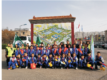
太原豪峰接待小学师生参观