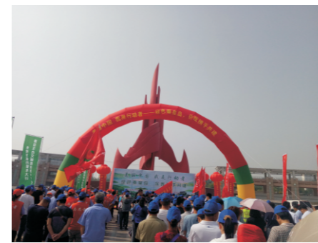
秦皇岛市六五环境日活动现场

2018年6·5世界环境日，北京中科国益环保工程有限公司员工来到南锣鼓巷，组织开展了“美丽中国，我是行动者”宣传环保公益活动，结合公司环保工作重点与公众关注的环境问题，用行动践行我们的宣言与奉献！