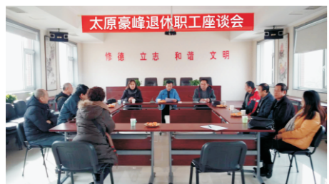
同谋发展 共叙友情 退休职工座谈会

国水（昌黎）污水处理有限公司一员工及其母亲分别于2018年5月和1月确诊肠癌，均接受了手术和化疗，病痛折磨着母女二人，巨额医疗费已将这个普通家庭掏空，肉体、精神和生活的压力几近压垮瘦弱的她。一方有难，八方支援，总公司得知该消息后立即号召全体员工伸出援手，献上一份爱心。虽然大部分人与她素不相识，但大家纷纷慷慨解囊，短短4天时间里累计收到善款近10万元，让身处病痛危难中的同胞看到一线生活的希望和信心，不仅体现了国中人的奉献精神，更是给予了母女俩战胜病魔的决心和信心。