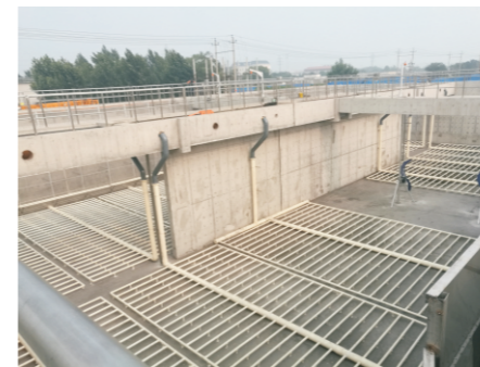
秦皇岛升级改造项目建设现场

2018年9月，秦皇岛市第四污水处理厂升级改造工程竣工验收，该项目位于秦皇岛市海港区龙港路10号，改、扩建工程总建筑面积7014m 2 ，为河北省重点挂牌督办项目和秦皇岛市重大民生工程、环境改善工程。工程于2016年6月22日开工，2018年6月30日完工，出水水质达到国家规定的一级A排放标准。