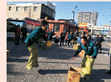
太原豪峰职工趣味运动会袋鼠运瓜比赛

2018年10月25日，太原豪峰污水处理有限公司举办“凝心、聚力、创佳绩”职工趣味运动会，来自公司各部门的6个代表队，40余人参加。本着团结协作、弘扬传统文化的原则，运动会设同舟共济、袋鼠运瓜、齐心协力、勇往直前、师徒上阵、跳绳、毽子和呼啦圈等团体或个人比赛，旨在进一步丰富职工的业余文化生活，提高职工队伍的凝聚力。