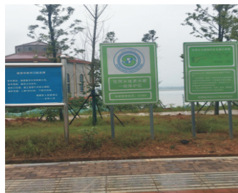
一级水源保护区内警示牌

公司持续对源水、出厂水、管网水每天进行常规检测，每月进行一次42项检测，每半年送到株洲水质检测中心进行106项水质指标检测，各项指标均符合国家生活饮用水标准。同时新增和更新了在线检测设备，对出厂水的PH值、余氯、色度、浊度进行在线实时监测，确保了水质安全。