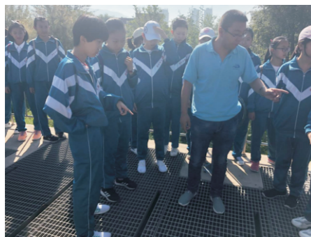
青海雄越接待初中师生参观

2018年4月26日，来自太原团市委、太原市环保局、ofo太原公司、中信银行太原分公司等80余名青年环保志愿者，身着统一的蓝色环保志愿者马甲，骑着ofo黄色共享单车来到太原豪峰污水处理有限公司，进行了以“探寻污水净化之旅，提高市民节水意识”为主题的百位市民看环保参观活动。