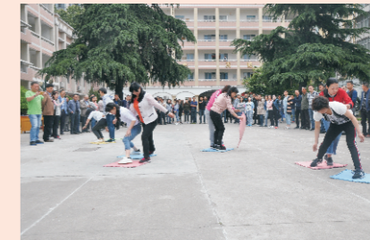
汉中水司庆五一员工文体娱乐活动过河接力赛

2018年4月26日，汉中市国中自来水有限公司举办庆五一员工文体娱乐活动，活动围绕“健康、快乐、敬业、奉献”的主题，通过挖坑、纸牌麻将、齐心协力接力赛、过河接力等赛事，充分激发广大员工的积极性，促进团队交流，加强了员工之间的沟通与信任。