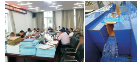
竣工验收总结会 计量槽出水效果一隅

2018年7月，荣县度佳镇等12个乡镇生活污水厂BOT项目竣工验收，验收组现场查验了厂区建设、进场道路、场外机电、场外接水、管网、处理效果等内容，并对我司的工艺和调试效果给予了充分肯定。该项目于2015年开始建设，在国中各级员工的不懈努力下，项目得到了地方党政机关和相关职能部门的大力支持，2018年5月，12乡镇13个厂站全部实现达标排放，成为国中水务响应国家建设美丽乡村的又一标杆。