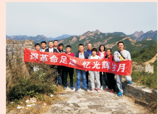
秦皇岛公司探革命足迹忆光辉岁月

2018年10月，国中（秦皇岛）污水处理有限公司组织庆国庆红色之旅活动，来到了素有“吊挂长城”之称的董家口长城，瞻仰革命圣地。活动增强了员工的爱国情怀，大家纷纷表示要继承弘扬革命前辈的优良传统，努力做好本职工作，为构建和谐社会贡献力量，把我们的国家建设得更加美丽。