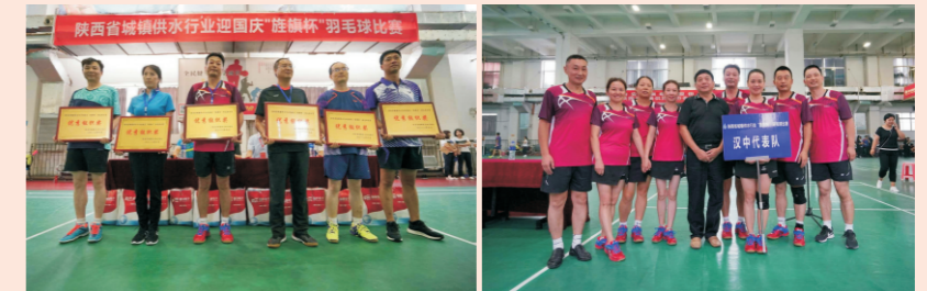
汉中水司健将“旌旗杯”羽毛球比赛

2018年9月13日至14日，在陕西省供水排水协会举办的首届陕西省供水行业职工羽毛球“旌旗杯”比赛中，汉中市国中自来水有限公司选派的羽毛球健将们发扬团结、顽强、拼搏精神，取得了男子双打第三名、女子双打第四名、混双第四名以及团体优秀组织奖，展现了汉中水司供水人良好的精神风貌和团队精神。