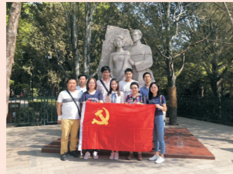
中科国益党员在高君宇、石评梅二人的雕像前合影

2018年5月4日“五四青年节”，北京中科国益环保工程有限公司党支部与团支部成员前往北京陶然亭公园开展“缅怀革命志士，践行五四精神”活动。传承“五四精神”，用新时代中国特色社会主义思想武装自己，牢固树立“四个意识”、坚定“四个自信”，在“贯彻学习十九大精神的基础上，永葆革命的精神和斗志，为实现中国梦而努力奋斗！