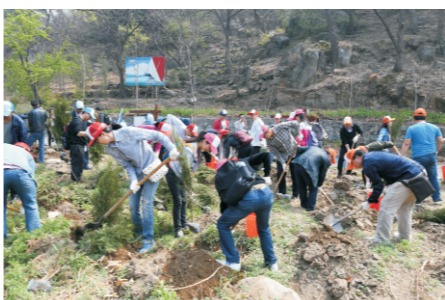
中科国益和水事业部联合组织植树造林公益活动

2018年6月5日，国中（秦皇岛）污水处理有限公司参加了秦皇岛市环保局组织的“美丽中国 我是行动者——绿色秦皇岛 你我携手共建”秦皇岛市六五环境日主题宣传活动，活动现场设立环保咨询台和投诉台，接受群众咨询及投诉。现场累计向群众发放“中央第一环境保护督察组对河北省开展‘回头看’工作明白纸”1500余份，发放环保知识手册及宣传用品7000余份。同时还开展了文艺表演、演讲比赛、环保知识现场问答等丰富多样的主题宣传活动。