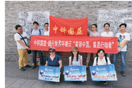
中科国益践行世界环境日公益活动

2018年5月18日，在第27届全国城市节约用水宣传周之际，汉中市国中自来水有限公司组织公司水质管理部、行政管理部、客户服务部等相关部门，在汉中市街心花园开展了供水节水宣传活动，向市民提供水质卫生知识、节水知识、节水器材、水质检测等专题咨询服务。合计发放宣传资料千余份，接待咨询服务八百余人次。在向广大市民宣传了城市供水节水的重要意义的同时，塑造了汉中水司良好的社会形象。