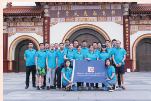
国中上海重智尚真凝力共进主题团建

2018年6月2日，国中（上海）环保科技有限公司赴江苏宜兴大觉寺及周边开展团队建设活动，围绕“重智尚真 凝力共进”主题，开展了佛教经典学习，并组织了各类趣味团队竞技活动。让员工在活动中逐渐参悟人生的正念、正见、正思维，激发基层员工的艰苦奋斗精神，鼓励中高层员工发现并修补在企业经营中存在的错误与缺陷，激励全体员工借助自己的智慧不断探求和接近各自工作领域的真理，加强团队沟通与协作能力，共同成就卓越人生、卓越企业。