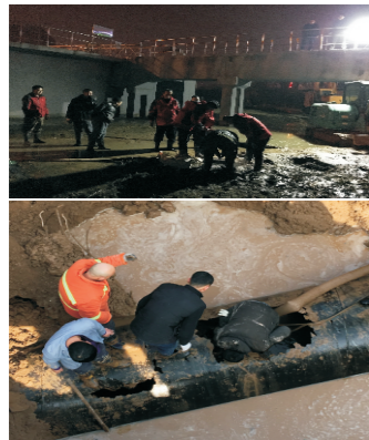
太原豪峰大年初二彻夜抢修

整个春节期间，员工们放弃了走亲访友的宝贵机会，废寝忘食、夜以继日地在抢修现场攻坚克难，守护着城市水网，为全市人民度过一个祥和平安的春节筑起坚强保障。