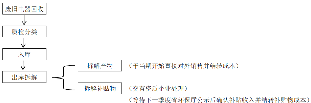
拆解业务简要流程：