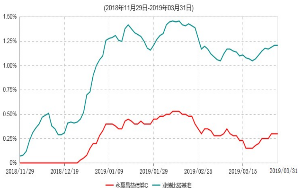
永赢昌益债券C累计净值增长率与业绩比较基准收益率历史走势对比图

注：1、本基金合同生效日为 2018 年 11 月 29 日，截至本报告期末本基金合同生效未 满 1 年； 2、本基金建仓期为本基金合同生效日起 6 个月，截至本报告期末，本基金尚处于建仓 期中。