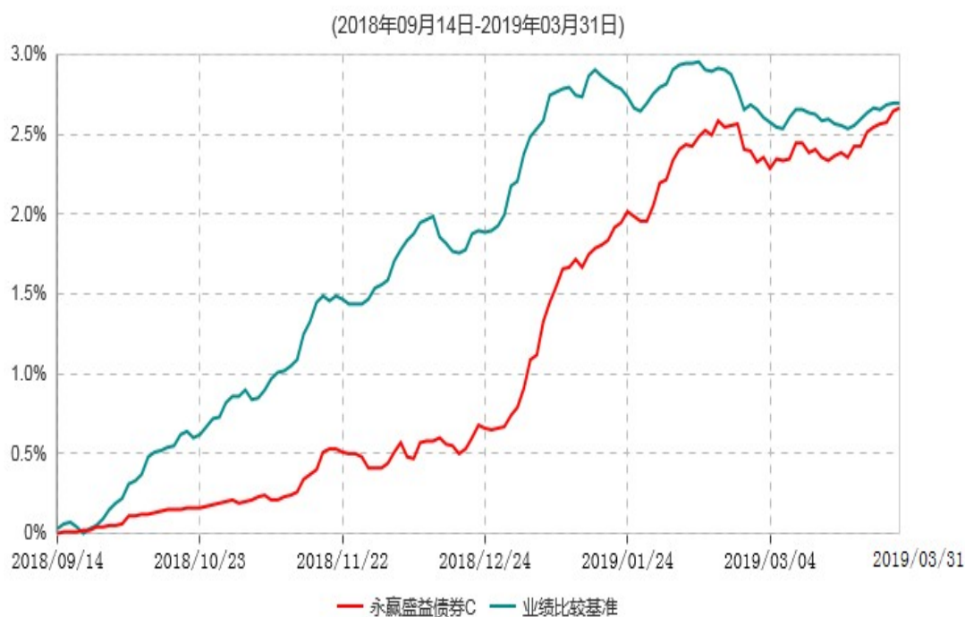
永赢盛益债券C累计净值增长率与业绩比较基准收益率历史走势对比图