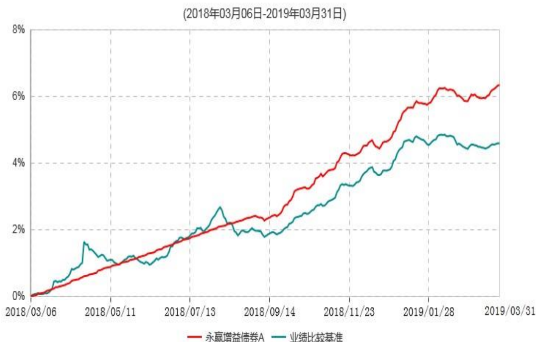
永赢增益债券A累计净值增长率与业绩比较基准收益率历史走势对比图

注：1、本基金建仓期为本基金合同生效日起 6 个月，建仓期结束当日，除债券投资比例未达到合同约定外，其他各项资产配置符合合同约定。债券投资比例未达到合同约定系交易对手原因导致现券买入交易结算失败所致，本基金于 2018 年 9 月 6 日及时买入债券将债券投资比例提高至合同约定的范围内。