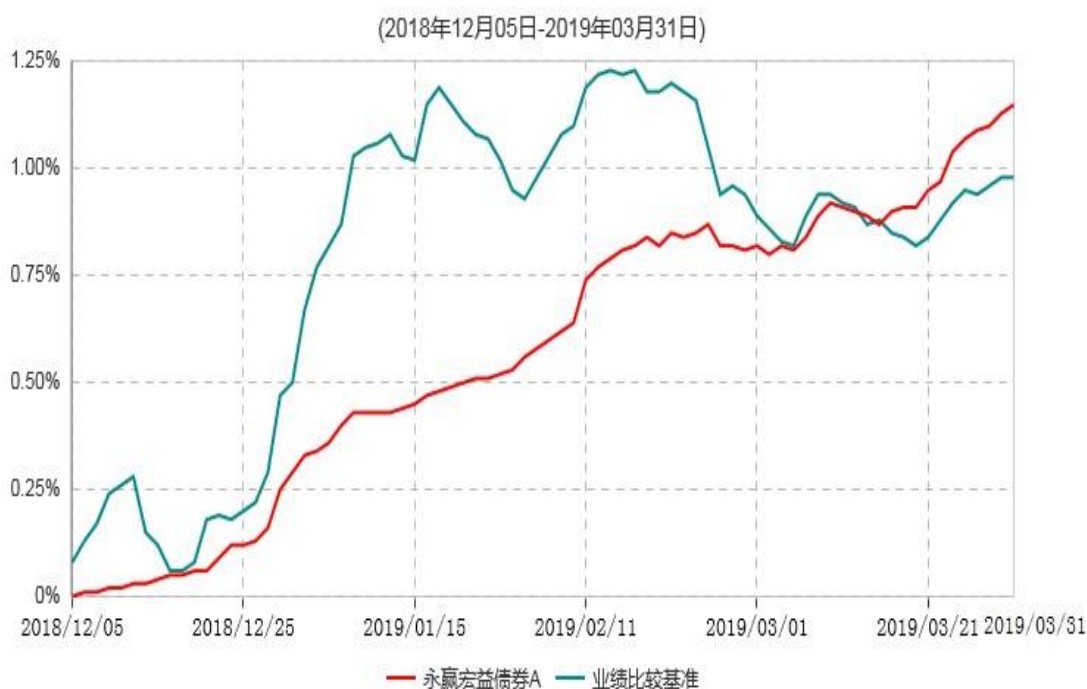
永赢宏益债券A累计净值增长率与业绩比较基准收益率历史走势对比图

注：1、本基金合同生效日为 2018 年 12 月 05 日，截至本报告期末本基金合同生效未满 1 年； 2、本基金建仓期为本基金合同生效日起 6 个月，截至本报告期末，本基金尚处于建仓期中。