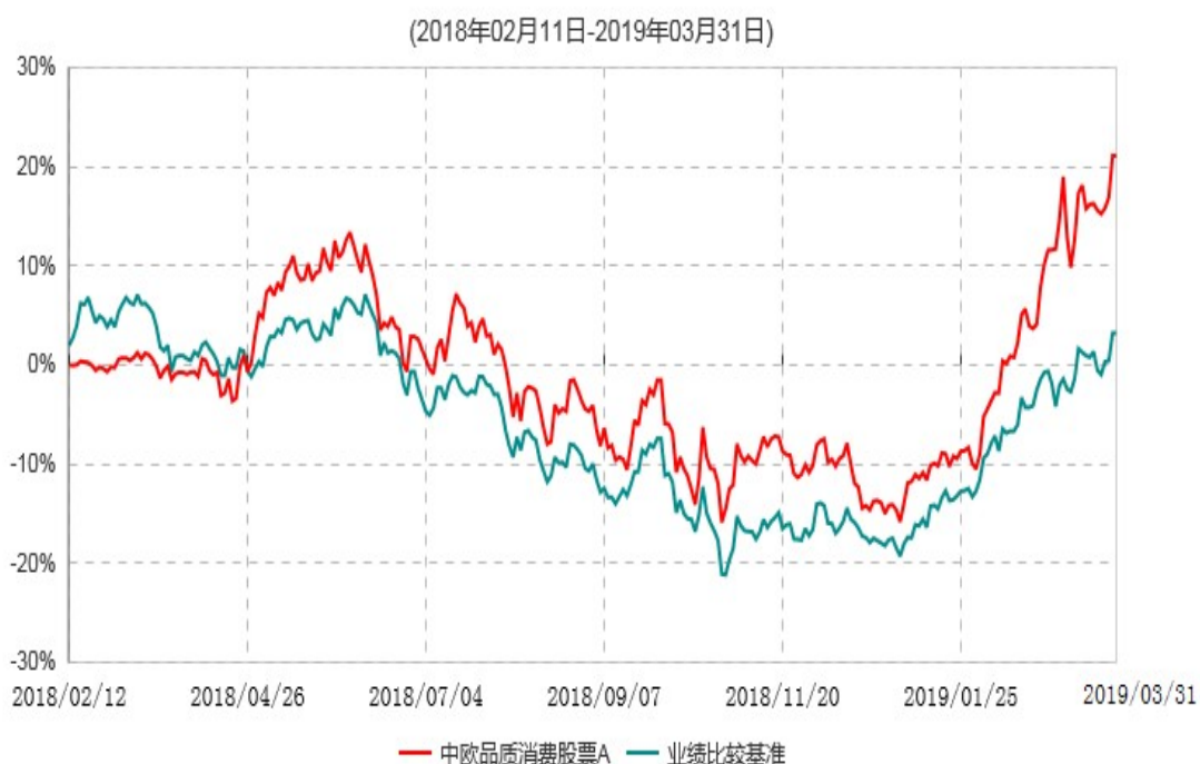
中欧品质消费股票A累计净值增长率与业绩比较基准收益率历史走势对比图

注：本基金基金合同生效日期为 2018 年 2 月 11 日，按基金合同的规定，本基金自基金合同生效起六个月为建仓期，建仓期结束时各项资产配置比例已符合基金合同约定。