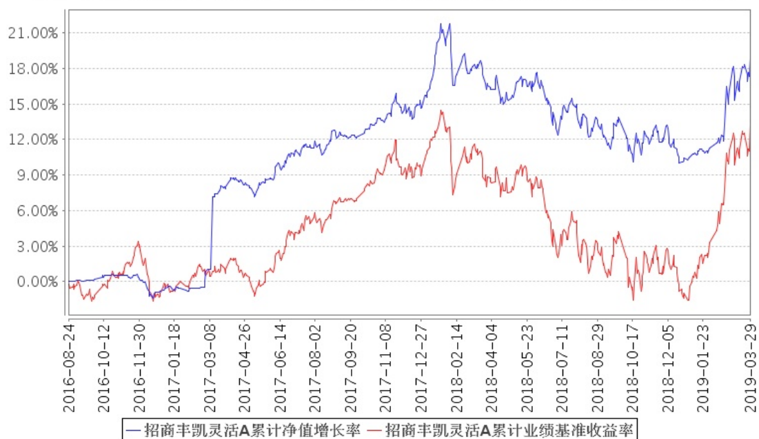
招商丰凯灵活A累计净值增长率与同期业绩比较基准收益率的历史走势对比图