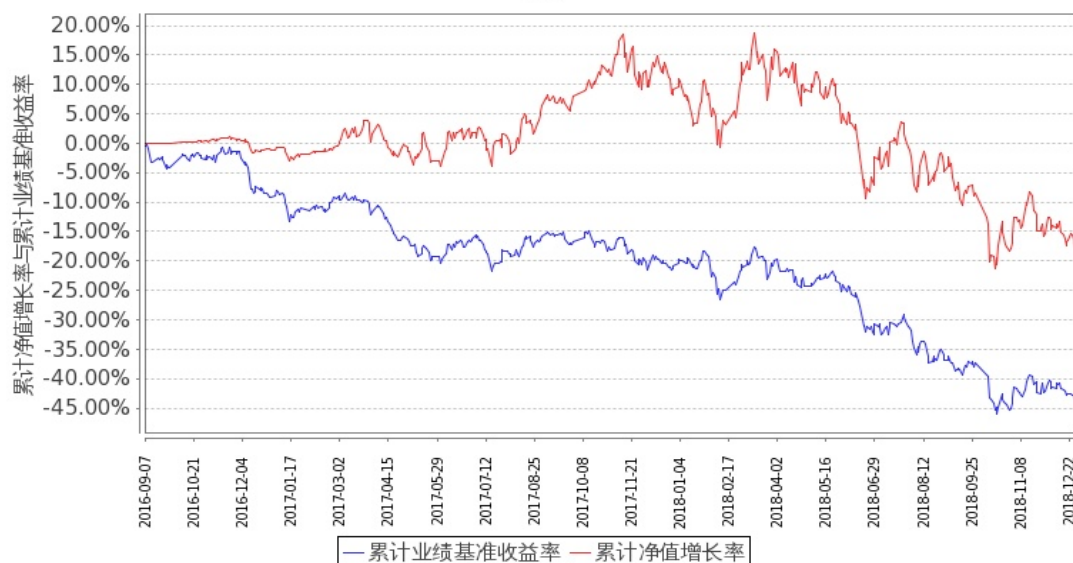
图 2：嘉实文体娱乐股票 C 基金累计份额净值增长率与同期业绩比较基准收益率的