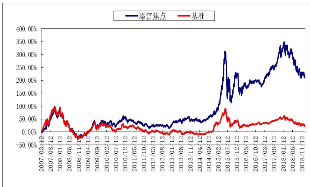
(二) 自基金合同生效以来基金累计净值增长率变动及其与同期业绩比较基准收益率变动的比较图