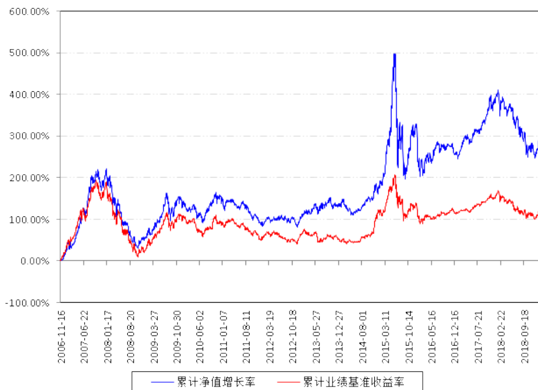
南方绩优A累计净值增长率与同期业绩比较基准收益率的历史走势对比图