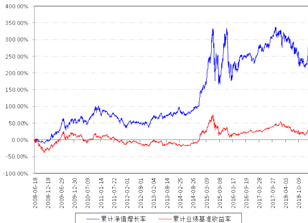
南方优选价值混合A累计净值增长率与同期业绩比较基准收益率的历史走势对比图