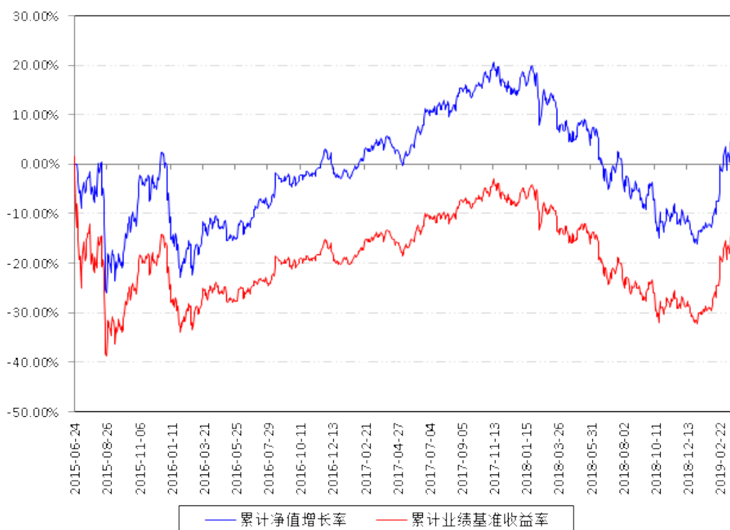
大数据300A级累计净值增长率与同期业绩比较基准收益率的历史走势对比图