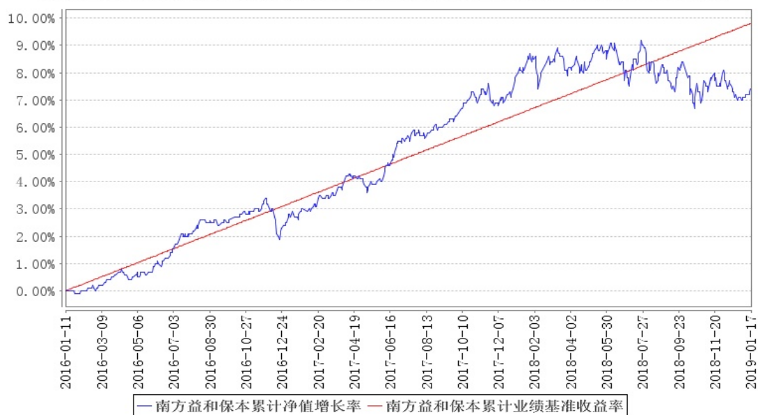
南方益和保本累计净值增长率与同期业绩比较基准收益率的历史走势对比图