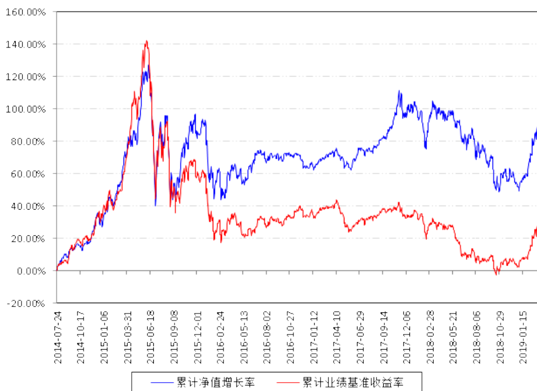
南方高端装备灵活配置混合A累计净值增长率与同期业绩比较基准收益率的历史走势对比图