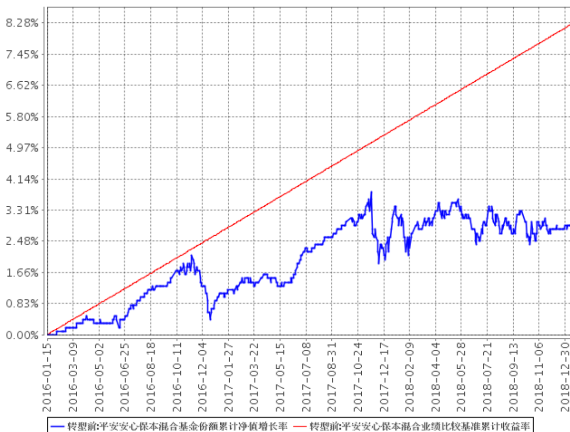
平安安心保本混合基金份额累计净值增长率与同期业绩比较基准收益率的历史走势对比图