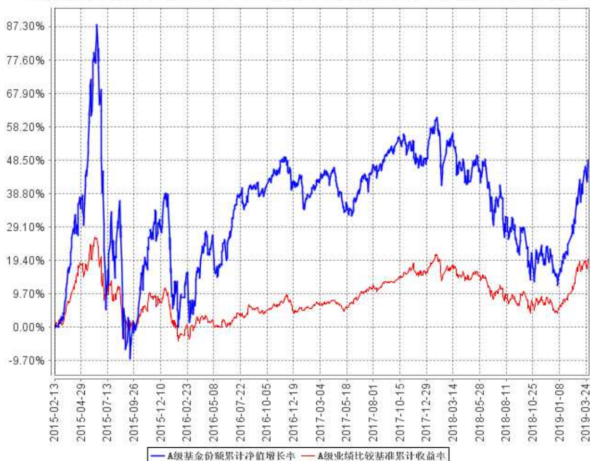
A 级基金份额累计净值增长率与同期业绩比较基准收益率的历史走势对比图