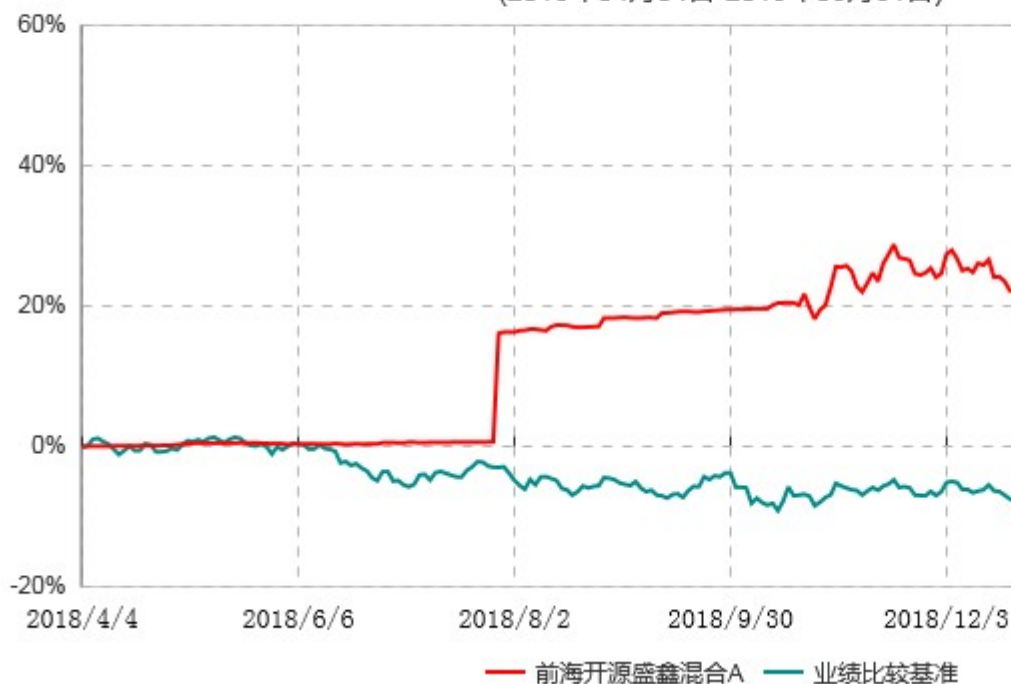
自基金合同生效以来基金累计净值增长率变动及其与同期业绩比较基准收益率变动的比较 B