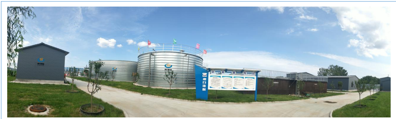
2018 年上半年承接仁和工业区 2500 吨临时污水处理站项目工程