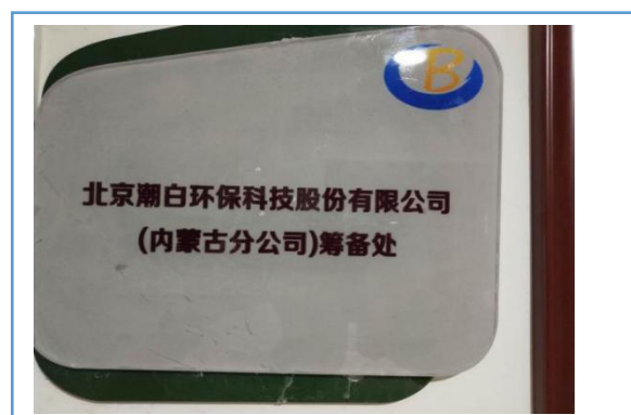
2018 年 5 月份在内蒙古呼和浩特市成立内蒙古分公司筹备处，开拓内蒙市场