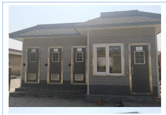
2018 年 10 月份研发了“厕所革命”第一代产品，采用玻璃钢材质，全部埋于地下，不占地表面积并成功应用在项目上。