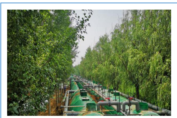
2018 年 6 月份承接天竺管楼 4000 吨临时污水处理项目工程