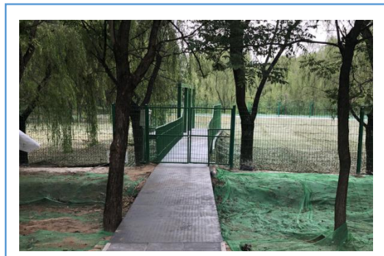
7 月份完成顺义区牛栏山镇 10000 吨，6.2 公里调水工程