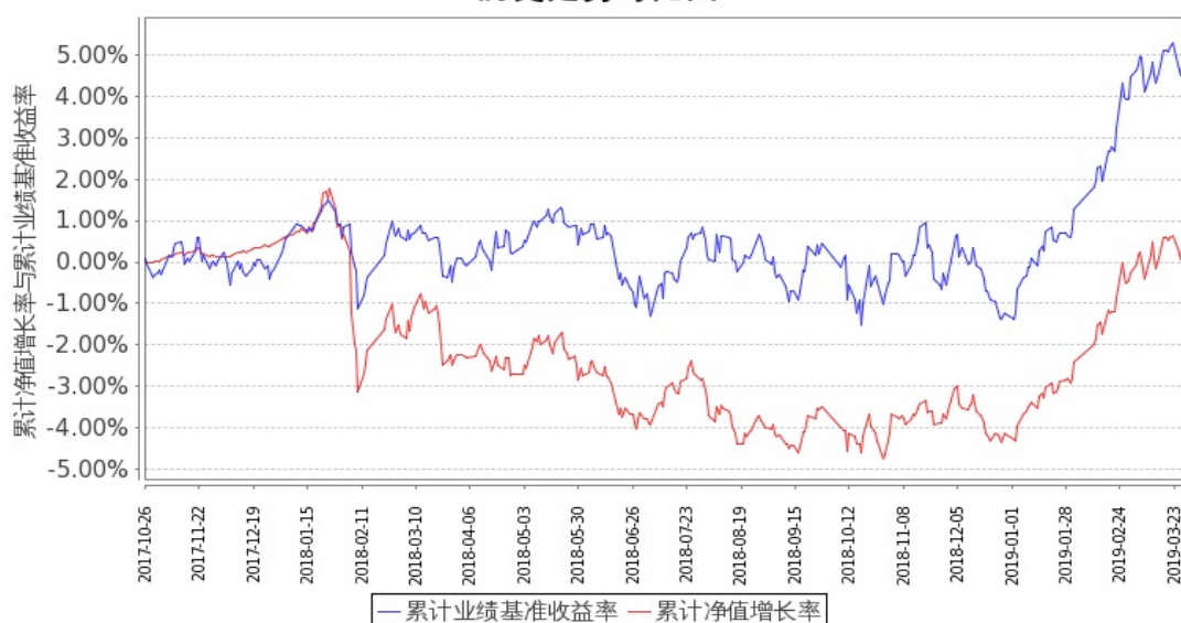
图1：嘉实领航资产配置混合（FOF）A基金累计份额净值增长率与同期业绩比较基准收益率的历史走势对比图 (2017年10月26日至2019年3月31日)