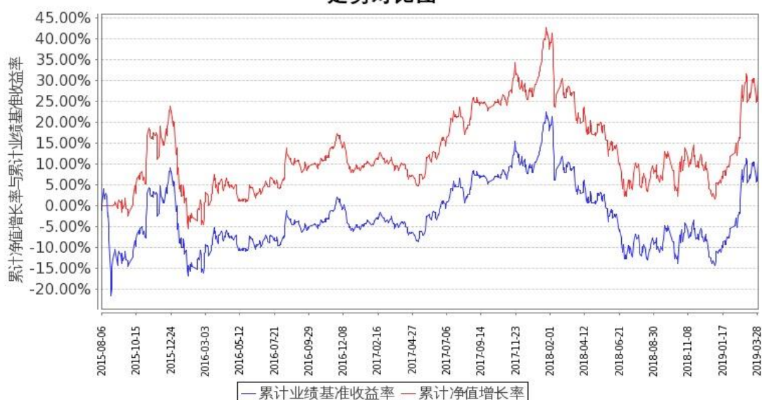
图 1：嘉实中证金融地产 ETF 联接 A 基金份额累计净值增长率与同期业绩比较基准收益率