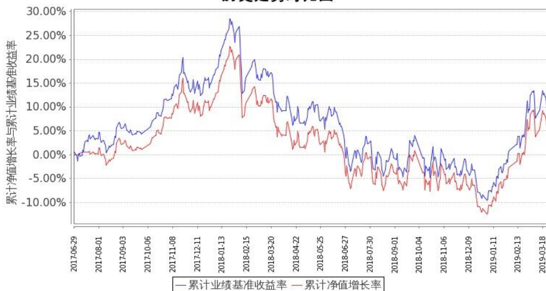
图 1：嘉实富时中国 A50ETF 联接基金 A 类基金份额累计净值增长率与同期业绩比较基准收益率的历史走势对比图