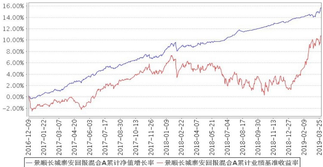
景顺长城泰安回报混合 A 累计净值增长率与同期业绩比较基准收益率的历史走势对比图