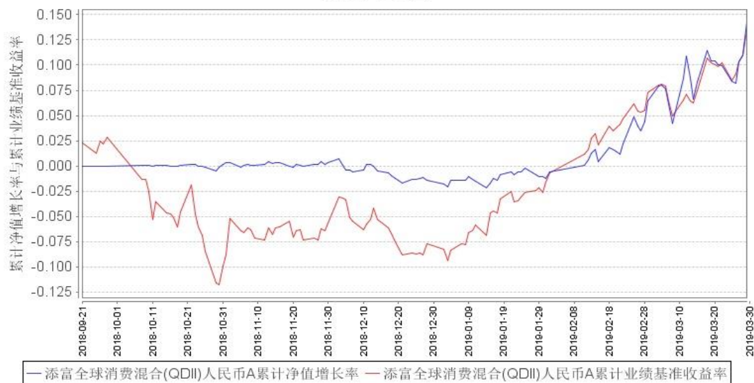
添富全球消费混合(QDII)人民币A累计净值增长率与同期业绩比较基准收益率的历史走势对比图