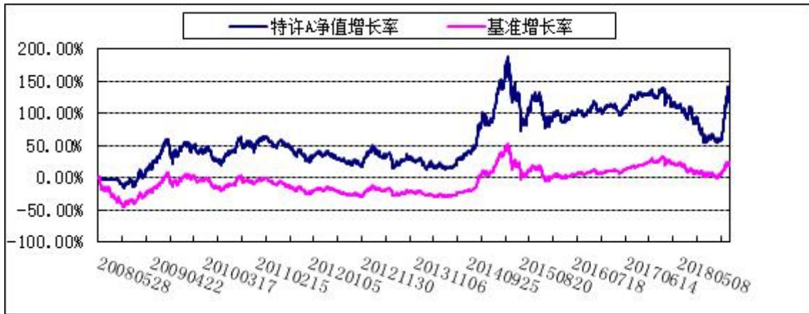
2. 博时特许价值混合R: