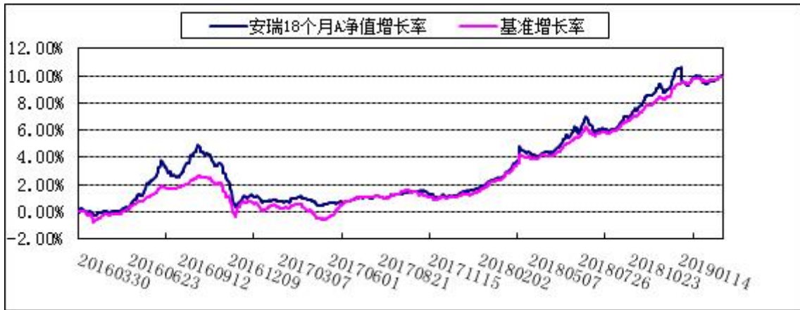
2. 博时安瑞18个月定开债C: