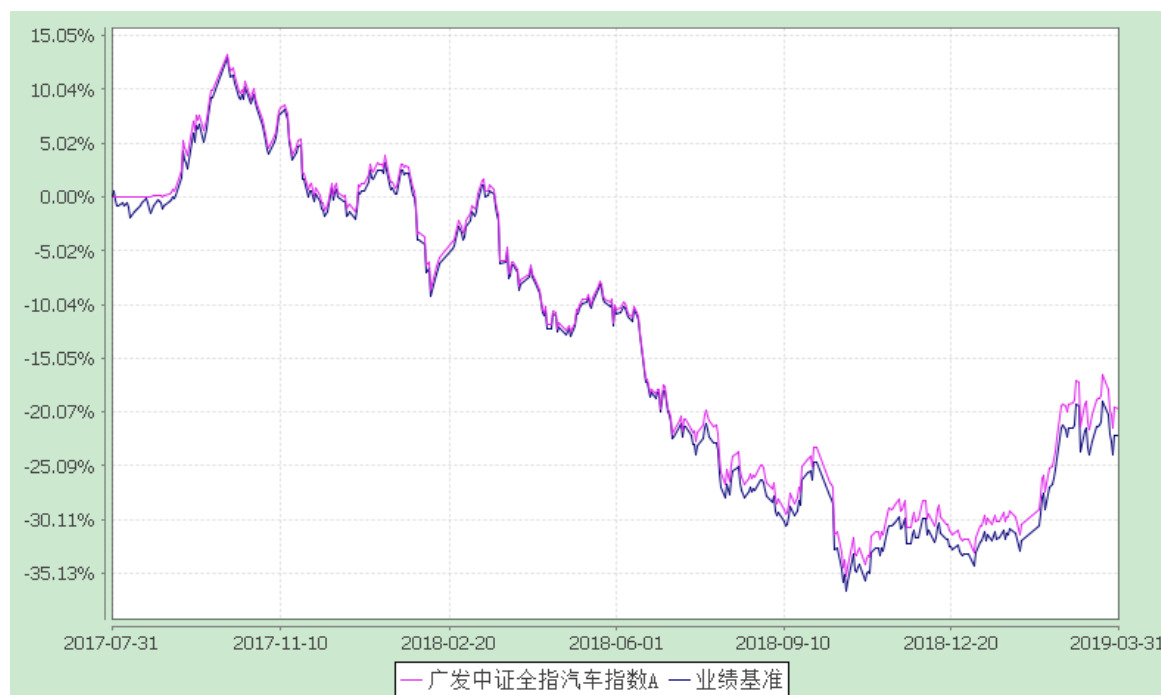
广发中证全指汽车指数 C