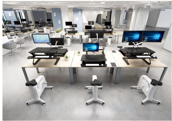
组合2：电脑升降台+电脑功能架+桌边健身车

通过智能升降桌、电脑升降台、电脑功能架、桌边健身车等产品单独或组合使用，改变了人们传统固定办公环境和方式，为用户日常工作和居家提供坐、站、动交替整体解决方案，针对性解决久坐人群普遍存在的颈椎病、腰椎病、心脑血管疾病以及因久坐引起的腰腹赘肉、肠胃不适等其他众多亚健康问题，大大提升用户办公舒适度及工作效率，让办公更健康。