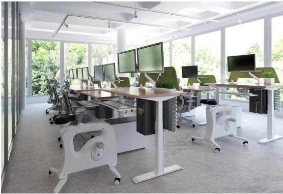
组合1：智能升降桌+电脑功能架+桌边健身车