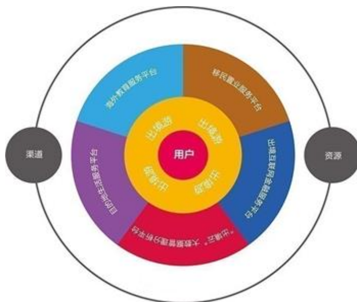
众信旅游集团旅游综合服务示意图

在旅游业务方面，公司将继续抓住市场快速发展的黄金时机，以服务品质为前提，以产品为核心，继续强化批发零售一体，线上线下结合的多渠道运营的发展战略，促进各项业务相互促进、协同发展。