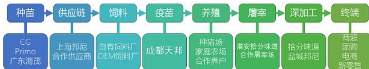
（图为公司全产业链协同发展布局）

报告期内公司主营业务和产品未发生重大变化，公司继续以生鲜猪肉及肉制品为主体、水产品为补充进行产业链的搭建和完善。