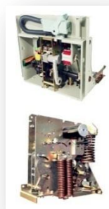
中高压断路器操作机构