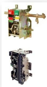
低压断路器操作机构