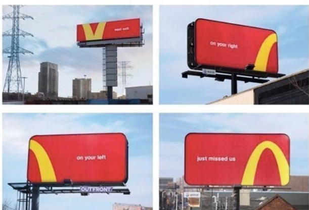
图1、Cossette 为麦当劳打造的“Follow The Arches”户外广告战役，一举斩获户外类广告全场大奖（Outdoor Grand Prix），这也是加拿大本土创意公司十余年来夺得的第一座全场大奖。