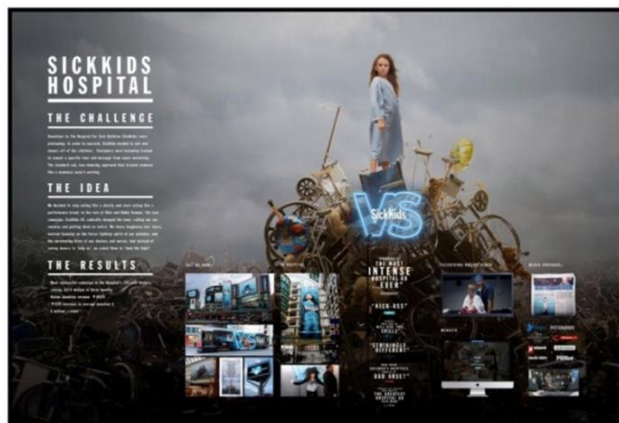
图2、Cossette 的 SickKids 公益项目获得“戛纳创意节实效奖”大奖，此奖项是第一次由加拿大本土公司获得。